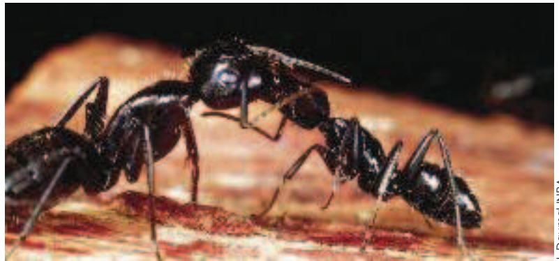
Fourmi ( Camponotus vagus ).