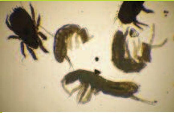
Acariens et collemboles.

ganiques sont recyclées) et, d'autre part de la nature même du sol qui permet une grande variété de niches (microporosité, macroporosité, dans ou à la surface des agrégats) et l'existence de gradients sur de très courtes ou plus grandes distances (zones appauvries ou enrichies en oxygène ou en eau, variabilité du pH ou des concentrations en matière organique, etc.).